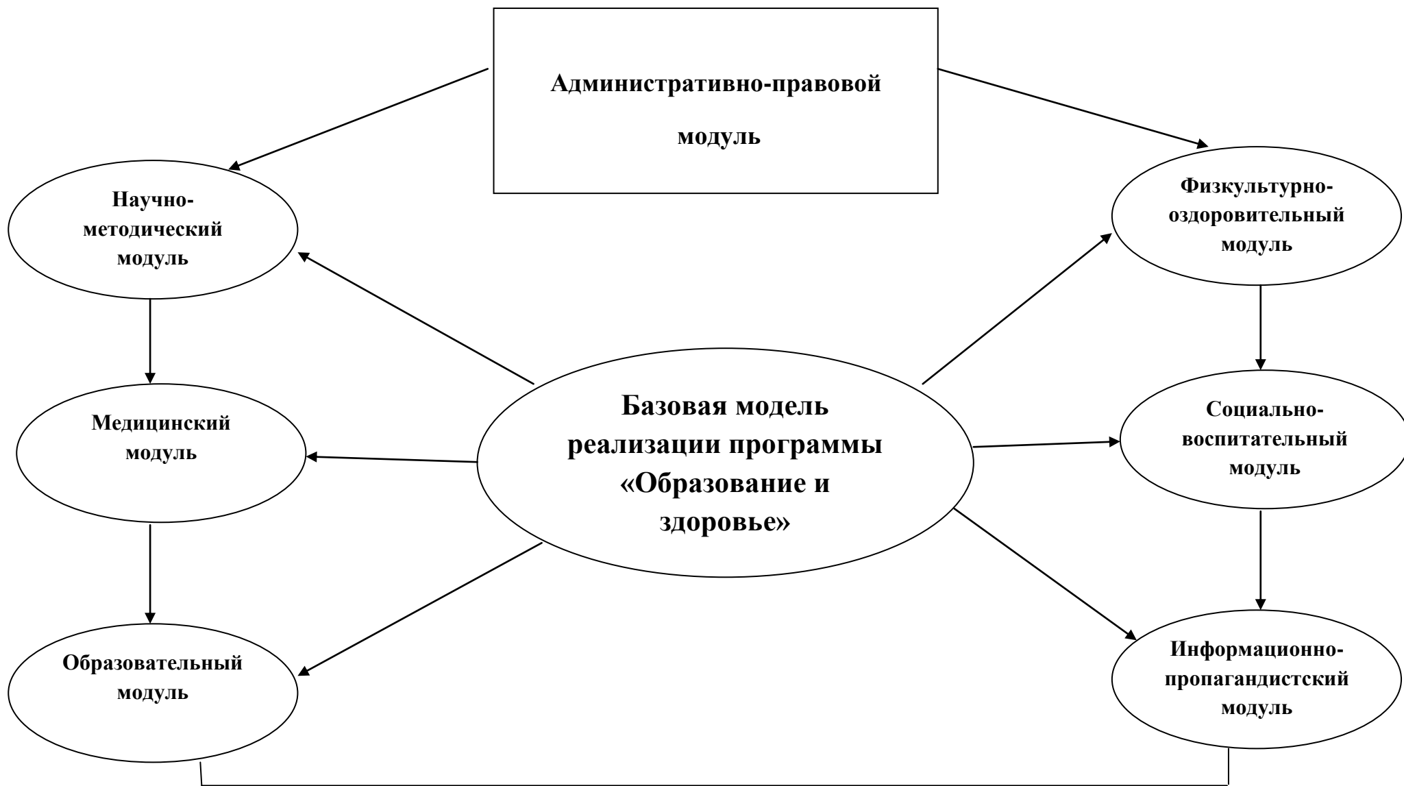
Рис. Базовая модель реализации программы «Образование и здоровье»